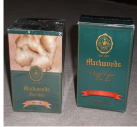
しょうが茶 と BOP 葉茶